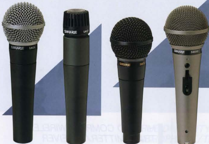
SM58-LC SM57-LC SM78EB-LC 588SD-LC

Shure microphones do something great for all these great voices