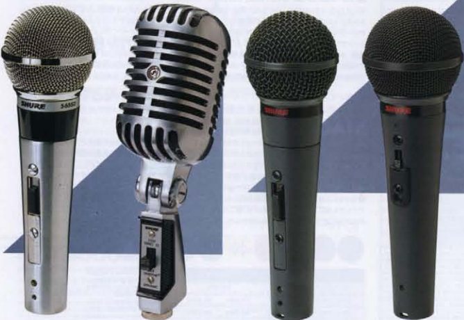
565SD-LC 55SH-S2 PE85L-LC PE15D-LC