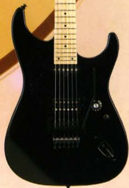
KS-85 ¥77,000 PAINT