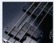
■ DIMAZIO MODEL P タイトでヘヴィな低音域を無理なく放出するMODEL Pは、重量感あるベースサウンドを生み出します。

M-120B ■ BODY: MAPLE ■ NECK: MAPLE (PIECE ■ JOINT: SET NECK ■ F. BOARD: ROSEWOOD, 22F, 30SR, 432 SCALE ■ PICK-UP: Front: DIMAZIO MODEL P, Rear: DIMAZIO MODEL P ■ CONTROL: 2VOLUME, 1TONE, 3WAY, SW ■ BRIDGE: LIVE FORCE-11 ■ COLOR: EB ■ PRICE: ¥120,000