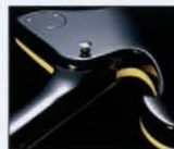
■ SET NECK JOINT

ミラージュ・コンセプトをまたひとつ押し進め、アームングブレイにも対応させる。もちろん、トレモロシステムにはフロイドローズ・オリジナルをセットアップする。