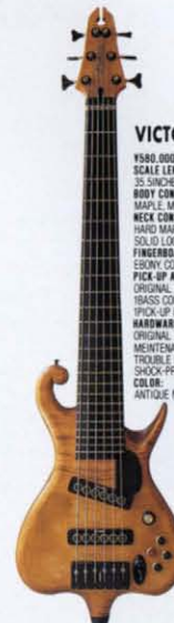
VICTORIA BS MODEL L900 65T

¥380,000 W/HARD CASE SCALE LENGTH: 34INCHES BODY CONSTRUCTION: MAPLE, MAHOGANY SP SPECIAL CUT-AWAY NECK CONSTRUCTION: HARD MAPLE, CARBON FIBER REINFORCED, SOLID LOCKED BOLT ON NECK FINGERBOARD: EBONY, CONICAL SHAPED, 24F, 43.2SCALE PICK-UP AND CONTROLS: ORIGINAL HUMBucker, 1 VOLUME CONTROL, 1 BASS CONTROL, 1 MIDDLE CONTROL, 1 TREBLE CONTROL HARDWARE: INDIVIDUAL TAILPIECE WITH BENDER, MAINTENANCE FREE BRIDGE, ADJUSTABLE STRING NUT, SHOCK PROOF RUBBER END-PIN COLOR: NATURAL