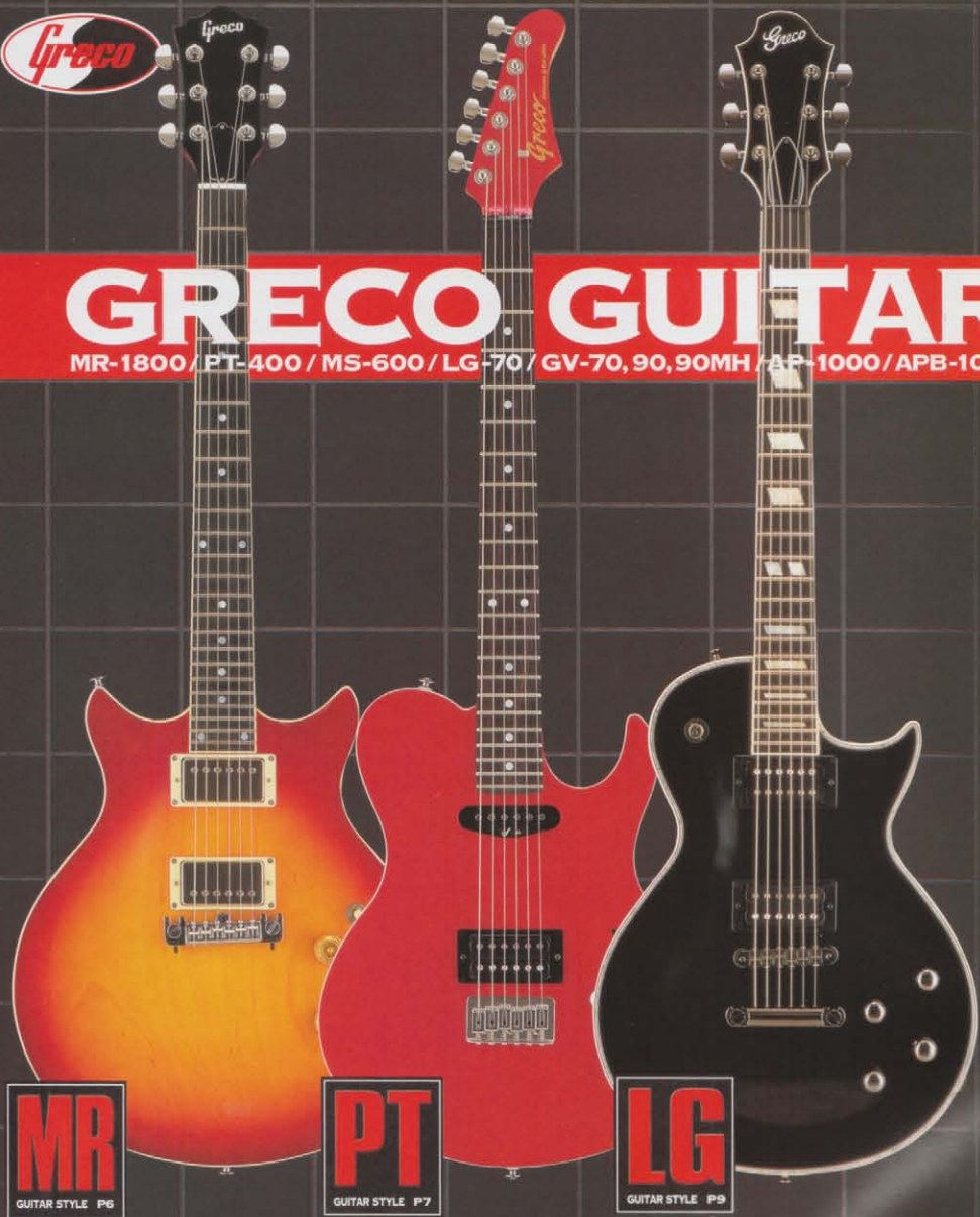
MR GUITAR STYLE P6

MR-1800 / PT-400 / MS-600 / LG-70 / GV-70, 90, 90MH / AP-1000 / APB-1000