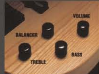
PRO-TECH ACTIVE (GPB-650に搭載)