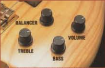
PRO-TECH ACTIVE CIRCUIT SYSTEM

ボディ：アッシュ / ネック：メイプル フィンガーボード：エボニー、305mmR ネック・ジョイント：PXジョイント(ボルト・オン) スケール：432mm / フレット：22フレット ピックアップ：PRO DUCE-P(フロント)、PRO DUCE-J(リア) ブリッジ：TIGHT HOLD BRIDGE コントロール：1ボリューム、1トレブル、1ベース、1パララサー サーキット：PRO-TECH ACTIVE フィニッシュ：リアル・ブラック(RB) / マドロン・ヴァイオレット(MDV) / シェルレー・ブラック(SBK) / ナチュラル(NT)