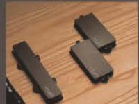
POWER STORM P-J (GPB-800,650共に搭載)

*GPB 全機種共、ハードケース(別売)はB-160(¥16,000)となります。