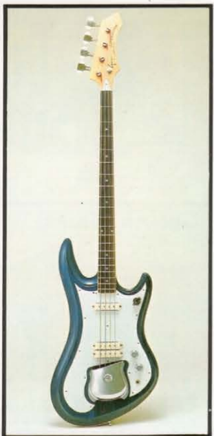
EB-9 Custom ¥70,000 (EB-9 Custom ¥60,000 ケース ¥10,000) スリムなボディから、はじき出される音は、アタックが強く、重低音を強調したサウンドです。 ●ボディ：メイプルまたはセン ●ネック：ハードメイプル ●指板：エボニー ●指板：アルニココンボイコイル×3 ●糸巻：クロムバー・102N ●ピックアップ：OF38mm 12F50mm ●寸法：854mm ●重量：4.3kg ●ピックアップセレクター：3点切換可能 ●V×1、E×1 ●カラー：ホワイト、ブルー、ナチュラル・ブラウン