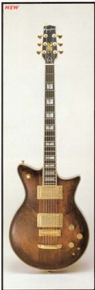
NEW Glory LG-1000 CUSTOM (標準) ケース ¥12,000 (選別) ¥150,000 贅沢の限りを尽くしたグローリーカスタム。日本のオリジナル・ギターを世界のギター・マーケットに浸透させるべく登場したインターナショナルなギターです。なお、カスタム・モデルは仕様の変更、彫刻などの特別注文も可能なオーダー・メイド・システム。写真はローリー・ギヤラガー仕様のベシック・モデルです。 ●ボディ：メイプル・アッシュ・トップ、マホガニー・センター、メイプル・バック ●ネック：メイプル ●指板：エボニー ●ピックアップ：ハムバッキングP-1500W×2 ●糸巻：クロムバー・10G ●ピックアップセレクター：3回路切換スイッチ ●コントロール：V、X1、T×2 フェイズスイッチ、3回路切換スイッチ ●寸法：648mm ●重量：4.1kg ●フィニッシュ：クラシカル・バイオリン塗装 ●カラー：マホガニー・ステイン、ナチュラル・ステイン、ブラウン・ステイン

これからのギターは、コピーモデルではなく、個性豊かなオリジナルモデルになるとGuyatoneでは考えます。グローリーはデザインだけではなく、ピックアップ、テールピース、ブリッジなどのパーツを素材から開発。その結果が、まろやかな甘い響き、それでいてくもりのないシャープなサウンドを生みだします。Guyatoneは、誇りを持ってMADE IN JAPANの刻印を”グローリー”に与えました。