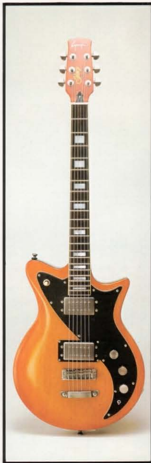
Glory LG-1000 DELUXE ケース ¥12,000 ¥100,000 あらゆるギターを併用し尽くしたギタリストに捧げるGuyatoneの自信作。ソフトであくまでモダンなサウンドは、日本のミュージック・シーンに登場して以来、僅か半年で竹田和夫、佐藤ミツル、秋山一将を始めとするトップ・ギタリストのステージ、レコーディングには欠かせない存在となっています。 ●ボディ：メイプル・カーブド・トップ、マホガニー・バック ●ネック：メイプル ●指板：エボニー ●ピックアップ：ハムバッキングP-1000W×2 ●糸巻：クロムバー・10N ●ピックアップセレクター：3回路切換スイッチ ●コントロール：V、X1、T×2 フェイズスイッチ ●寸法：648mm ●重量：4.0kg ●フィニッシュ：クラシカル・バイオリン塗装 ●カラー：ナチュラル・ブラウン、ブラウン・サンバースト