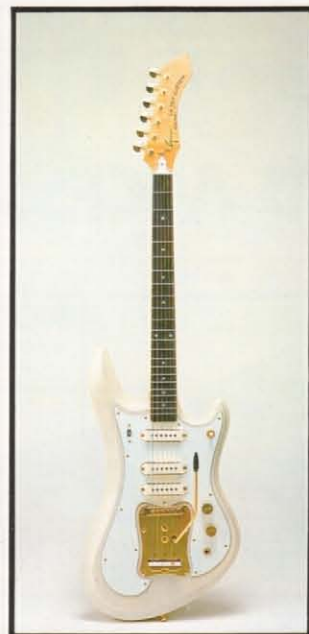
LG-350T Custom ¥69,000 (LG-350T Custom ¥60,000 ケース ¥9,000) 日本人の体型にあわせたボディ、ネック形状と、パーツ類、全てを自社開発したオリジナル・ギター・ルーツ。 ●ボディ：メイプルまたはセン ●ネック：ハードメイプル ●指板：エボニー ●指板：アルニココンボイコイル×3 ●糸巻：クロムバー・102N ●ピックアップ：OF40mm 12F49.5mm ●寸法：628mm ●重量：4.1kg ●タイプ：エグジィトレモロ ●ピックアップセレクター：3点切換可能 ●V×1、T×1 ●カラー：ブルー、ナチュラル・ブラウン、ホワイト、ブルー・メタリック