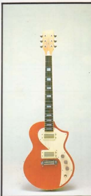
LG-880 MARROLY ¥88,000 (LG-880 ¥80,000 ケース ¥8,000) 当社の1960年モデルLG-50を基盤に、当社スタッフR・ギヤラガーとの協同開発によるプロフェッショナル・モデル。 ●ボディ：メイプル ●ネック：メイプル ●指板：エボニー ●指板：ローズウッド ●ピックアップ：フルレンジ専用使用アルニココンボイコイル×2 ●糸巻：クロムバー・102N ●3回路切換スイッチ ●V×2、T×2 ●コントロール：OF43mm 12F52.5mm ●寸法：648mm ●重量：4.1kg ●カラー：ナチュラル・ブラウン、ブラック、サンバースト

オリジナル・ギターだけが持つ、独特のデザイン、音質、弾き易さ。Guyatoneでは創業以来、オリジナル・ギターの開発に力を入れてきました。Guyatoneオリジナル・シリーズは日本のギターのルーツと言えます。