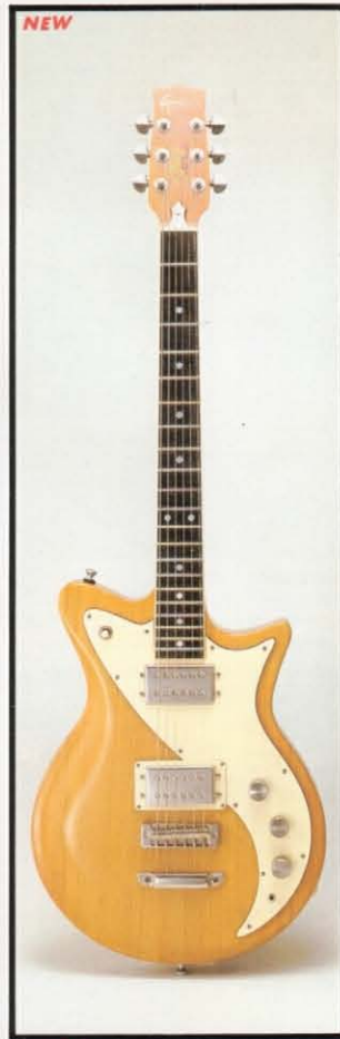
NEW Glory LG-1000 STANDARD ケース ¥12,000 ¥70,000 グローリー・シリーズの設計思想を受け継ぐコストパフォーマンスに優れたギターです。セン単板削り出しボディとP-700ハムバッキング・コイルが生み出すサウンドは、あくまでもクリアで現代のロック・シーンの主流を成すものです。また、軽いステージ・アクションに適した3.8kgの軽量ボディです。 ●ボディ：メイプル・カーブド・トップ ●ネック：メイプル ●指板：ローズウッド ●ピックアップ：ハムバッキングP-700W×2 ●糸巻：トルク調整トロンナタイプ ●ピックアップセレクター：3回路切換スイッチ ●コントロール：V、X1、T×2 フェイズスイッチ ●寸法：648mm ●重量：3.8kg ●フィニッシュ：クラシカル・バイオリン塗装 ●カラー：ナチュラル・ブラック、チェリー・レッド、ウォルナット