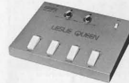
LESLIE QUEEN FS-7