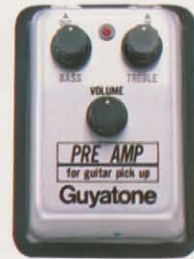
A-1 ピックアップ用プリアンプ ¥5,500

生ギター専用ピックアップGP-1。高出力(40mV)設計だからアコースティックなサウンドが思いのまま。本体はボディ内部ブリッジ裏面にセット。コネクタはスマートなエンドピン型 ★発電方式：セラミック型★出力電圧(平均値)：40mV★出力インピーダンス：70KΩ/1KH★最適負荷インピーダンス：1MΩ以上