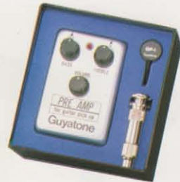
GP-1 ピックアップ&プリアンプ ¥7,500

ピックアップの性能をフルに引き出す専用プリアンプ。高入力・低出力インピーダンス設計で歪みは極少。オペアンプICの採用により、驚異的な低ノイズ特性を獲得している。 ★入力インピーダンス：10MΩ/1KH★出力インピーダンス：10KΩ★コントロール：ボリューム、トレブル、バス★電源：DC9V(006P×1)★寸法：70W×50H×97Dmm★重量：250g