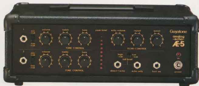
AE-5 アナログ・エコー ¥39,800

テープ不要のアナログ式エコーマシンAE-7。入力信号が大きい時に音が重なり、入力信号が小さい時にエコーが充分にからなかったりといった、従来のアナログ式の問題を一挙に解消した新回路設計です。適正入力と、エコーレベルがひと目でわかるツインインディケータ装備。テープ交換、ヘッドクリーニング等も不要でオールラウンドにどんな楽器にも対応。 ★コントロール：マイクボリューム×2、インストロメントボリューム、トレブル、バス、エコーボリューム、リビート、スピード★デレイタイム：100~350m sec★ピークレベルインディケータ：インプットレベル、アウトプットレベル ★その他：フットスイッチ・ジャック★寸法：433W×120H×225Dmm★重量：4.5kg