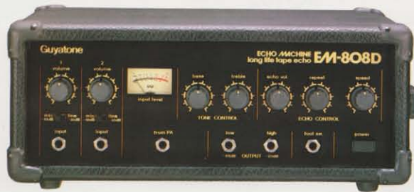
EM-808D テープ・エコー ¥44,000

テープ不要のアナログ・エコーマシンAE-5。BBD素子採用によりテープを使用する事なくクリアなエコーサウンドを再現。ワウフラッターが無く、テープ交換、ヘッドのクリーニング等も不要。半永久的に効果的なエコーを楽しむ。マイク、ギター、キーボード、PAとオールラウンドに適合。入力オーバーを点灯して知らせるピーク・レベル・インディケータ装備。 ★コントロール：入力ボリューム×2、トレブル×2、バス×2、エコーボリューム、リビート、スピード★デレイタイム：60~350m sec★ピークレベルインディケータ：9素子★その他：フットスイッチ・ジャック、★寸法：350W×140H×155D mm★重量：3.5kg