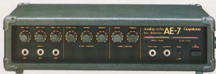
AE-7 アナログ・エコー ¥58,000

テープ不要のアナログ式エコーマシンAE-7。入力信号が大きい時に音が重なり、入力信号が小さい時にエコーが充分にからなかったりといった、従来のアナログ式の問題を一挙に解消した新回路設計です。適正入力と、エコーレベルがひと目でわかるツインインディケータ装備。テープ交換、ヘッドクリーニング等も不要でオールラウンドにどんな楽器にも対応。 ★コントロール：マイクボリューム×2、インストロメントボリューム、トレブル、バス、エコーボリューム、リビート、スピード★デレイタイム：100~350m sec★ピークレベルインディケータ：インプットレベル、アウトプットレベル ★その他：フットスイッチ・ジャック★寸法：433W×120H×225Dmm★重量：4.5kg