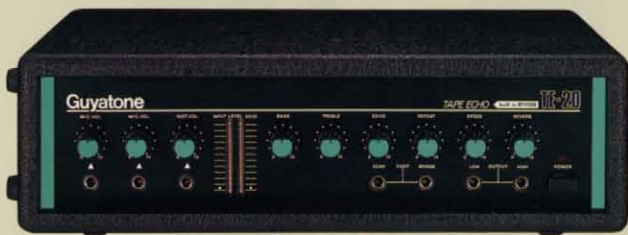
TE-20 デイレイリバーブ内蔵 テープ式エコー ¥68,000

スタジオ機器並のデイレイリバーブ・サウンドが得られるリバーブ内蔵型のテープ式エコーマシンです。通常のエコーとして、またエコー+デイレイリバーブとして、さらにデイレイリバーブとして、3種のサウンドが得られるフレキシブルなエコーマシンです。