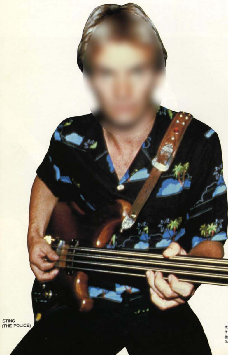
STING (THE POLICE)

バックステージでのスティンは、研ぎすまされた眼光だけが彼の音楽を照っているもの、ロジカルに、そして言葉を選んで静かに語る我々のグッドフェローだ。彼の洗練された知性と音楽的インテリジェンスがIBANEZ Bass に正しい筋肉をほどこしてくれている。