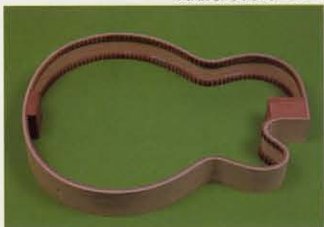
◆JP20もわすかなシン・ポディー

JP20 ¥165,000 COLOR ES HARD CASE JP150C ¥15,000 FEATURES Maple back and side with Spruce top, Maple three ply neck, 22 frets, Ebony fingerboard, 24.75 inch scale, Smooth Tuner II machineheads, JP-Special Ebony bridge and Ebony tailpiece, One Super 58 pickup, One volume and one tone controls.