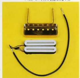
◆GB-SpecialピックアップはGB-10のための ピックアップでも、小さくたってちゃんとハム バック、ハウリング防止も万全です。

GB30 ¥120,000 COLORS TR HARD CASE GB153C ¥15,000 FEATURES Maple ply body, Mahogany one piece neck, 22 frets, Ebony fingerboard, 24.75 inch scale, Smooth Tuner II machineheads, Quik Change II tailpiece and Gibraltar II bridge, Two volume and two tone controls.