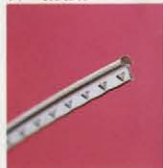
◆JP20は、25.5インチのスケールに このスリム・フレットを使用、微妙なク ャッチでヒューマニティーあふれる彼の サウンドを支えます。

音楽する人格にふさわしい品位と、第一 級のサウンド・クオリティ、まさに、キン グ・オブ・ギターです。