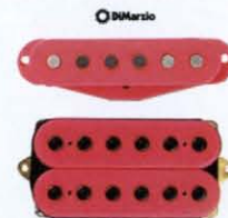
DiMarzio FS-1 Single Coil P.U. DiMarzio PAF PRO Humbucking P.U.