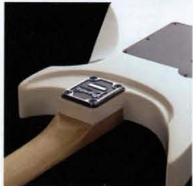
Cutaway Heel Neck Joint