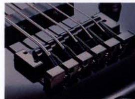
Accu-Cast B V Bridge

BODY MATERIAL: Basswood FINGERBOARD: Rosewood (45mm at Nut, 67mm at 24Fret, 305mmR) = SR885 Ebony (45mm at Nut, 67mm at 24Fret, 305mmR) = SR05 NECK: Maple (19mm at 1Fret, 21mm at 12Fret) SCALE: 34.0 inch NECK JOINT: All Access Neck Joint PICKUP: Front IBANEZ LO-J5 Rear IBANEZ LO-J5 BRIDGE: STANDARD 5ST. = SR885 ACCU-CAST B V = SR05 CONTROL: 1 Balancer, 1 Vol. & EQ-BII System (Bass, Treble) HARDWARE: Black