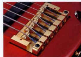
Accu-Cast B VI Bridge