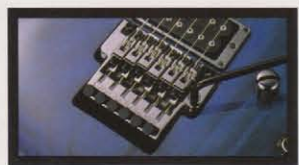
LO-PRO EDGE Tremolo フロイドローズ・ライセンスでアイビースがオリジナル・デザインしたLO-PRO EDGEトレモロは、チューニングの安定性、アーミングのスムーズさと完璧な音質のあるシステムです。ロー・プロファイル化したことにより弦交換も簡単にでき、またスプリング・チューナーが手動に調整可能なリチューニングが狂う心配もありません。