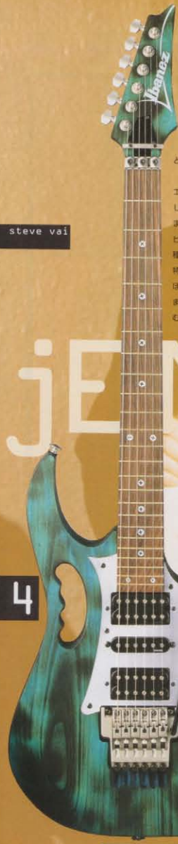
JEM7 BSB 来春発売予定

JEM 魔法のようなプレイアビリティと顕著的美しさを兼ね備えたギターは、ほとんど存在しない。また、フィンガーボードでの優れたテクニクとユニークなダイアセノスの高方を兼ね備えたギタリストも決して多くはない。しかし、アイビースJEMシリーズと、そのデザイナーでもあるSTEVE VAIは、その数少ない例外である。