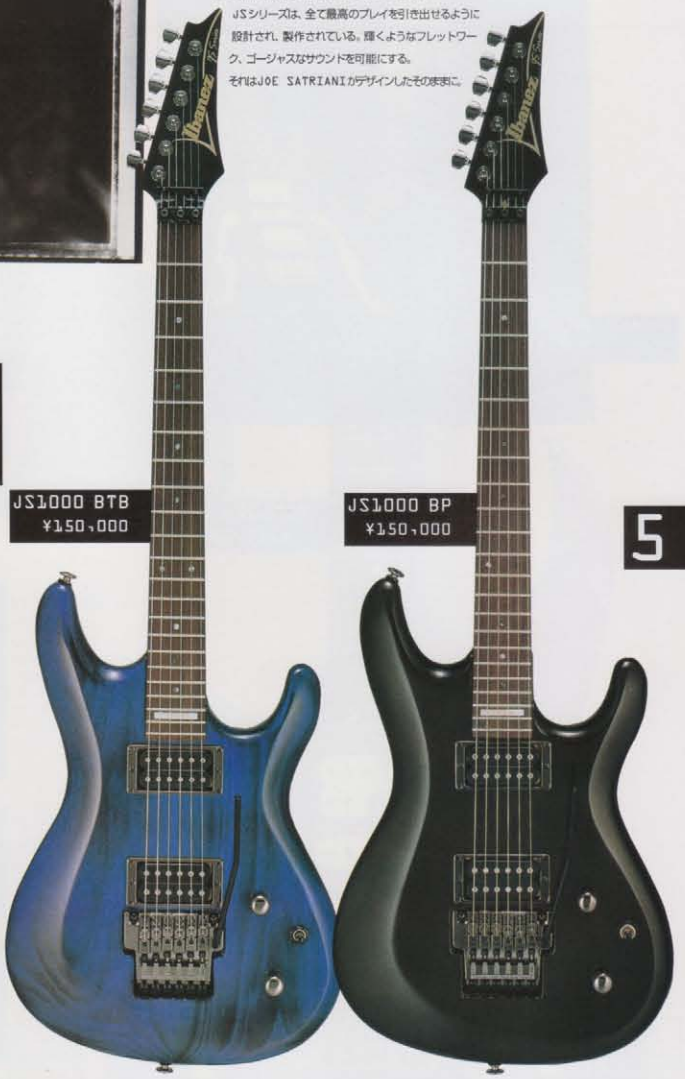
JS1000 BP ¥150,000