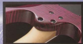
ALL ACCESS Neck Joint

フロイドローズ・ライセンスでアイハースがオリジナル・デザインしたL0-PRO EDGEトレモロは、チューニングの安定性、アーミングのスムーズさと完璧のあるシステムです。ロー・プロファイルにしたことにより演奏も簡単に行え、またフレット・チューナーが手にあたりチューニングがむづかしくありません。