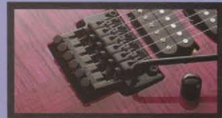
L0-PRO EDGE Tremolo

フロイドローズ・ライセンスでアイハースがオリジナル・デザインしたL0-PRO EDGEトレモロは、チューニングの安定性、アーミングのスムーズさと完璧のあるシステムです。ロー・プロファイルにしたことにより演奏も簡単に行え、またフレット・チューナーが手にあたりチューニングがむづかしくありません。