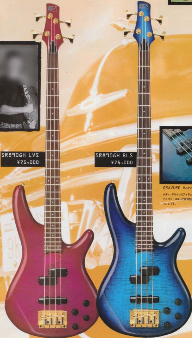
SR890GH LVS ¥75,000