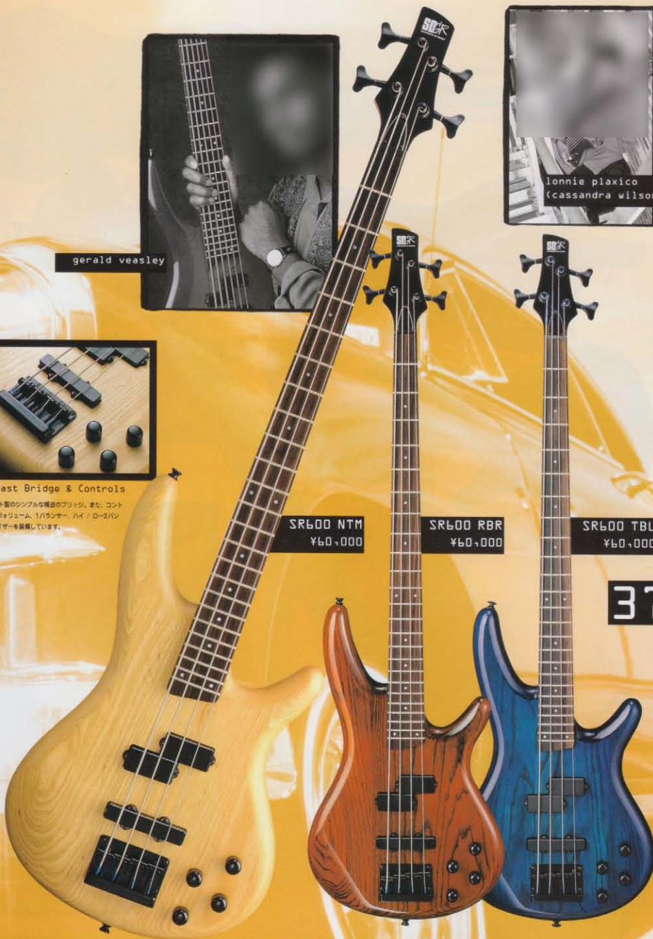
SR600 NTM ¥60,000