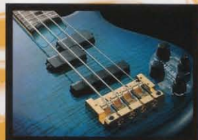
GRAVURE Hard Maple Finish ボディデザインのアイテムとして登場したグラビュア・フィニッシュ。アイバニーズならではの技術で生まれた、華やかに美しいフィニッシュです。