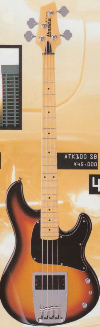
ATK100 SB ¥45,000