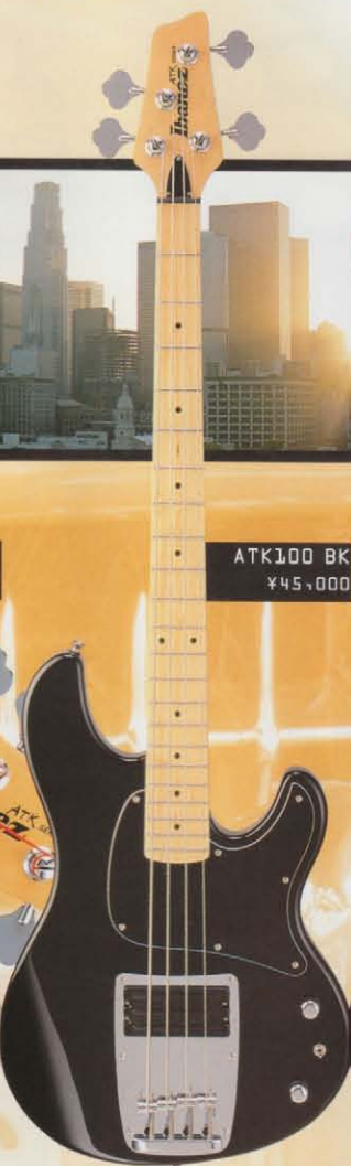
ATK100 BK ¥45,000