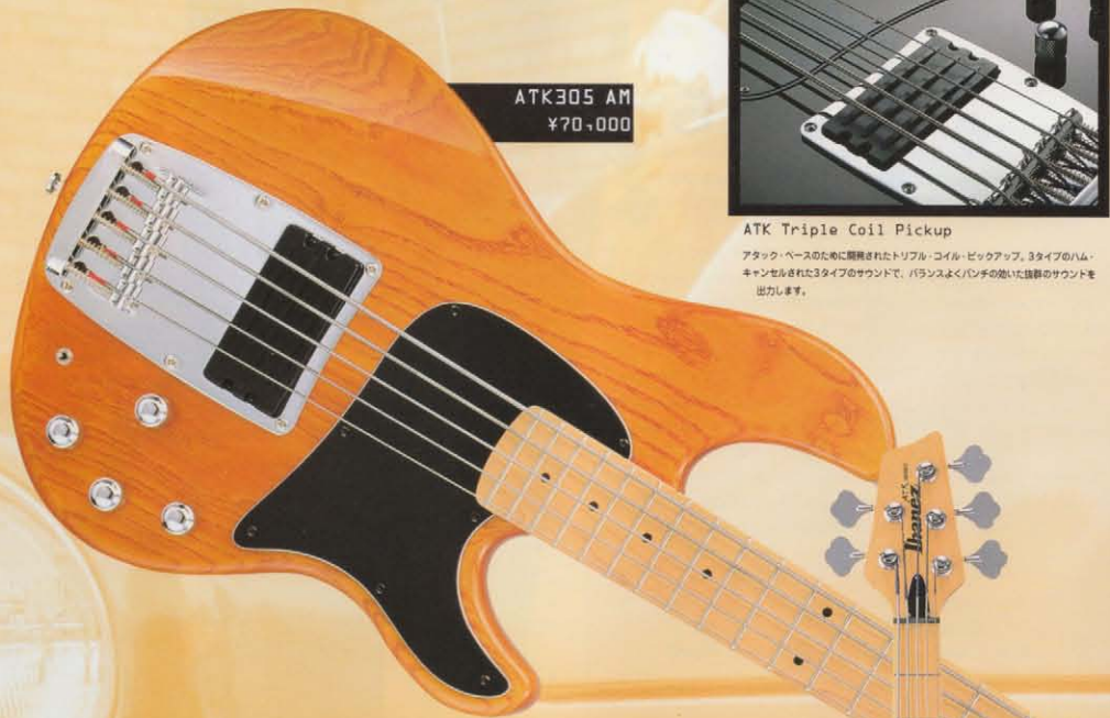
ATK305 AM ¥70,000