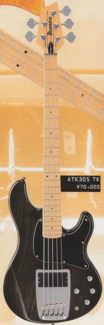
ATK305 TK ¥70,000