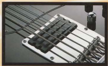
ATK Triple Coil Pickup

アタック・ベースのために開発されたトリプル・コイル・ピックアップ。3タイプのハム・キャンセルされた3タイプのサウンドで、バランスよくハンドの熱い独自のサウンドを出力します。