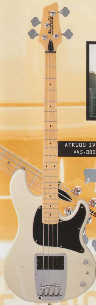
ATK100 IV ¥45,000