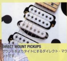
DIRECT MOUNT PICKUPS サウンドをよりタイトにするダイレクト・マウントです。

PAULとアイバニーズは彼の初期のアーミング・プレイを愛するプレイヤー達のことも忘れていない。PGM300はトレモロ・システムLO-PRO EDGEが、最適なアーミングからピブラートまで安定したチューニングをキープする。バスクッドのボディにDiMarzio® PAF PROとDiMarzio® JEM SINGLEピックアップをダイレクト・マウントすることで、魅力的なビッグ・トーンを実現している。LO-TRS IIトレモロ・システムを装備しているPGM300はバスクッド・ボディにアイバニーズINF1、INF51、INF2ピックアップをマウントしている。ホワイト・カラーとカーラージュ・ブルー・カラーの2モデルをラインナップ。PGMシリーズは全てオートマチック・デュオ・サウンド・システムが採用されており、ハーフ・トーン・ポジションでハムバッカーがタップされ、より多彩なサウンド作りが可能になっている。また、トレード・マークともいえるVホール・エンブレムがPGMに彩りを加えている。