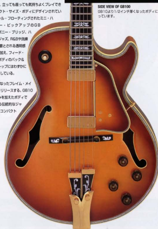
SIDE VIEW OF GB100 GB10より1/2インチ厚くなったボディになっています。

1993年には、さらに華麗になったフレーム・メイプル・トップのGB100をリリースする。GB10スタイルで1/2インチ厚みを加えたボディである。それでも、いわゆる伝統的なジャズ・ギターに比べればまだコンパクトである。