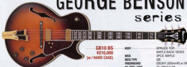
GB100 BS ¥210,000 (w / HARD CASE)

BODY SPRUCE TOP, MAPLE BACK/SIDES 3PCS. MAPLE GB EBONY (305mmR) w/BINDING NO. FRET / TYPE 22 / REGULAR INLAY PEARL / ABALONE BLOCK EBONY NECK P.I.I. BRIDGE P.I.I. HARDWARE COLOR GOLD AVAILABLE COLOR: BS, NT