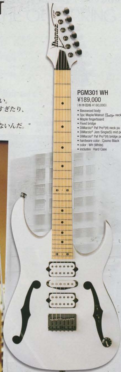
PGM301 WH ¥189,000 (本体価格 ¥180,000) ● Basswood body ● Spc Maple/Walnut Zepp neck ● Maple fingerboard ● Fixed bridge ● DiMarzio® Pat Pro®(H) neck pu ● DiMarzio® Jem Single(S) mid pu ● DiMarzio® Pat Pro®(H) bridge pu ● hardware color : Cosmo Black ● color : WH (White) ● includes : Hard Case