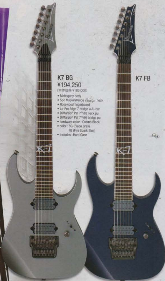
K7 BG ¥194,250 (本体価格 ¥185,000)