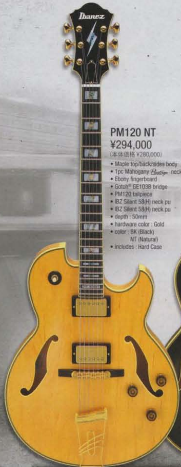
PM120 NT ¥294,000