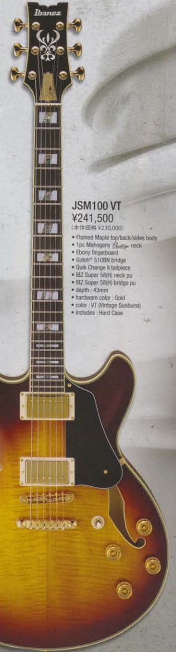
JSM100 VT ¥241,500