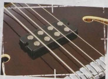
IBZ "ACHB-1" pickup

セミ・ホロウ・ボディならではの温かくウォームなレゾナンスと豊かなサスティーン、クリアな音程感、安定したチューニング、そして現代のバンド・サウンドの中でも存在をしっかりとアピールするアウトプットを備えた、伝統的なスタイルに新しい可能性を注ぎ込むARTCORE セミ・アコースティック・ベース。