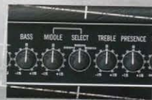
Active 4-band eq ±15db のブースト/カットを おこなうアクティブ 4 バンド EQ。