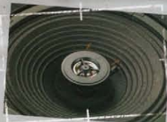
SW20/SW35 Coaxial speaker ウーファーとツイーターの音が自然に混ざり合っ て聞こえる同軸スピーカー