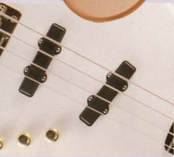
J-J165 Bartolini シェスルーレッド

フロントのピックアップは、スラントセット、よりワイドレンジなバランスと粘りが得られ、リアピックアップとのブライントなミックスサウンドは、J-J BASS サウンドならではの音色。 J-J BASSは、パワー、バランスを操作性においてもスタジオワークからライブステージまでオールマイティなプレイが可能。全く新しいカスタム・ベースです。もちろん、海外・国内のトップ・プロベーシストたちが使用している理由がわかっていたらと思います。