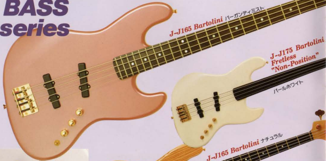
J-J165 Bartolini バーガンティニスト