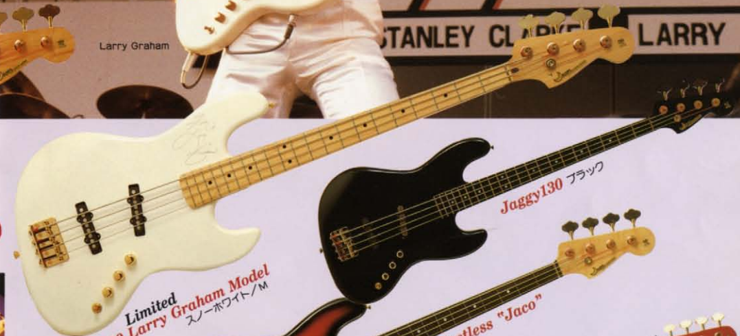
Limited Jaggy130 Larry Graham Model スノーホワイト/M