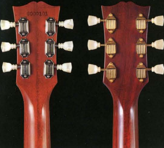
クルーソソ (Made in U.S.A.) (LCシリーズ)