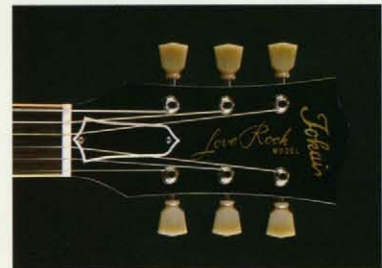
LS200V・VFヘッドストック

●LS200V、150Vは完全受注製作システム、ノカーリーメイプルのシーズニングからはじまり、ブックマッチング・2ピーストップのセグレーション、ボディ加工、フィニッシュ、組み立て等、特に製作ラインが通常のモデルと異なるため完成までに多くの時間を要します。一生に一本といえる究極の2モデル、受注後3〜6ヶ月、製作期間がかかることとあらかじめご了承ください。(世界のプロミュージシャンのオーダーとともに希少なオーダーブックモデルも提供されます。)