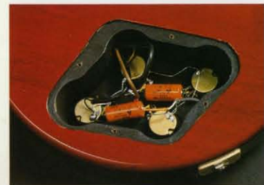
LS200V・VFコントロールキーキャット