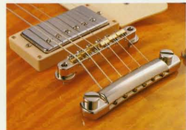
LS200V・VFテールピース&ブリッジ