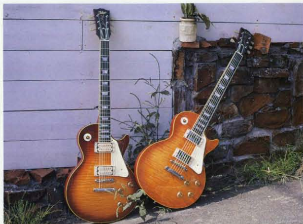
LS200V・OS / LS200V・VF

1952年、ソリッドギターシーンにセンセーショナルに登場して以来、その完成された美しさとヴァーサタイルなサウンドによりエレクトリックギターの歴史をはぐくみ、多くのミュージックシーンで革命的かつ重要な役割を果たしてきたオールスタンダード。このエレクトリックギター王者ともいえるオールスタンダードの時代を越えて、カイトLSシリーズとして、鮮やかな復活。オリジナルのマテリアルと個性をそのままに再現した2モデル——ヴィンテージモデル、'58スタンダードモデルの登場です。完全ソリッドによる2ピースメイプルトップ、マホガニー単板バツク、そして本邦初のマホガニー1ピースネックの採用。また、モデルヘッドストックにベストマッチングのオールドクルーソンシングルナルタイプペグをはじめ、ブリッジ、テールピース、マウンテイングリング、ソーサーノブ、アメ色スイッチノブなど細部のパーツにいたるまでオリジナルを徹底分析。ハードウェアはまさに本物とLSシリーズのみみることのできるスペシャルスベックです。特にヴィンテージモデルでは世界でも希少なカーリー・メイプルをトップに採用、トラモクスタンダード・レプリカモデルとして発売以来、プロミュージシャンをはじめオールギターマニア垂涎の的となっています。