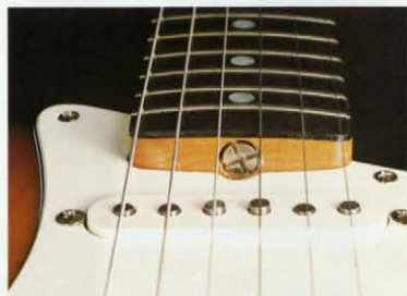
ST80-YSR ロースネック&アンプストラット