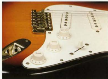
ST80-YSR コントロールセクション