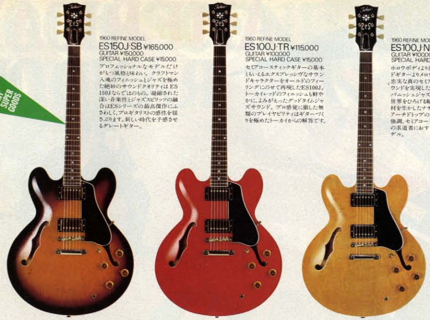
1960 REFINE MODEL ES150J SB ¥165,000 GUITAR ¥150,000 SPECIAL HARD CASE ¥15,000 プロフェッショナルなモデルだけが持つ風格と味わい。クラフトマン入魂のフィニッシュとジャズを極めた絶妙のサウンドクオリティはES150Jならではの、凝縮された実用・音楽性とジャズセリックの融合はESシリーズの最高傑作にふさわしい。プロギタリストの感性を揺さぶる。新しい時代を感じる超ダレートギター。