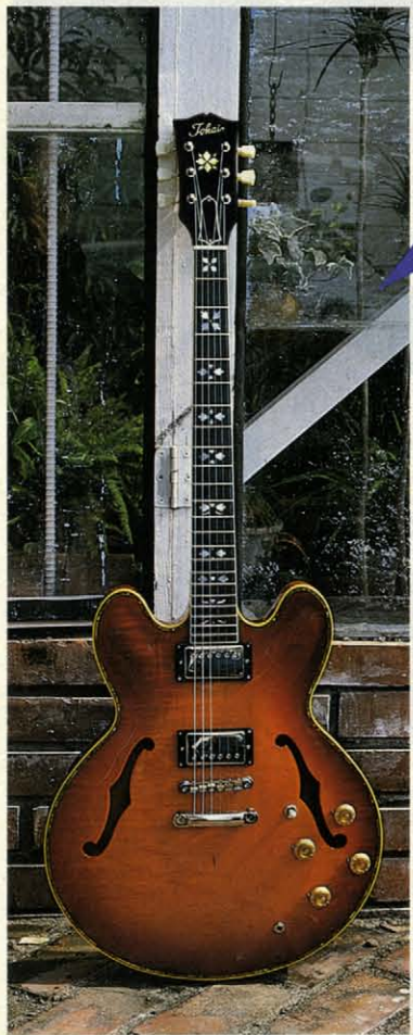
1982 TOKAI ORIGINAL MODEL ES200 VF ¥195,000 GUITAR ¥180,000 SPECIAL HARD CASE ¥15,000 至高のギターを求めMY FAVORITE GUITAR SERIESとしてプロダクトされたES200・VF。厳選されたメイプルトップ&バック、センターブロック、エポニーフィンガーボード、そしてアロンパールも鮮やかなアラバスタインディング仕様、ハーツ&フラウインレイ等、ゴージャスかつハイクレドなパフォーマンスは世界の最高峰。絶妙のサウンドクオリティ、変幻自在なトータルカラーはニューサウンドヴァイブレーションの到来を感じさせます。[写真はプロタイプ]

セミアコースティックギター界に新局面をひらき、一躍センセーショナルなサウンド革命を巻き起こしたESシリーズ。いままでのあらゆるタイプのセミアコースティックギターとは一線を画す、まったく新しいサウンドコンセプトをもった2モデル。エレクトリックスパニッシュロック、エレクトリックスパニッシュジャズの登場です。ロックにはロックのためのピックアップ、ジャズにはジャズのためのピックアップをマウントして、それぞれの個性をはっきりと主張しています。さらにNEWアイテムとしてESシリーズの最高峰、ES200も登場。セミアコースティックギターのアイデンティティを確立しました。