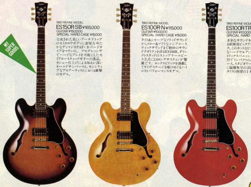
1960 REFINE MODEL ES150R SB ¥165,000 GUITAR ¥150,000 SPECIAL HARD CASE ¥15,000 完成された美しいアーチドトップのセミホロウボディに表現力ゆたかなディマジオPAF・カーブドタイプをマウント。プログレッシブでハードなプレイを可能にしたセミアコースティックギターの逸品。カシメ仕上げによる味わい深いオールドサンバースト。センシティブなプロアーチストにおくる衝撃のモデル。