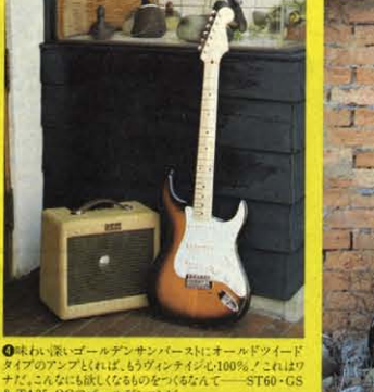
㉖ 1957 MODEL

㉗ トラディショナルモデルのヴィンテージとオールドモデルの精鋭をい。アメリカングラフィティを地味に'54モデルと'60モデルに思わぬ生ツバゴキリ。アメリカ人のアーティストが来目のたびにこのモデルをねらるのもはなはかわかる。