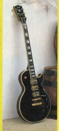
⑨ 1957 REFINE MODEL