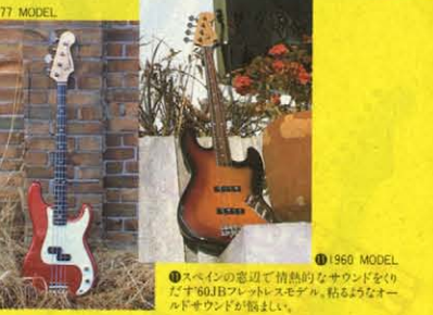
⑰ 1954/1960 MODEL