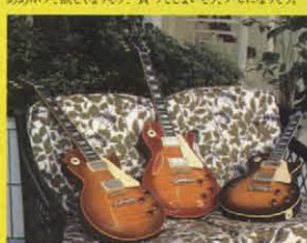
⑪ 1959/1959/1959 MODEL