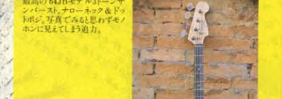
⑱ 1948/1969 TOKAI ORIGINAL MODEL