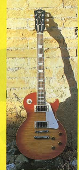
⑩ 1959 MODEL