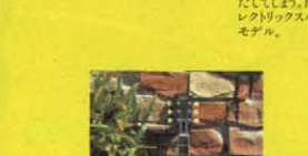
⑫ 1960 REFINE MODEL