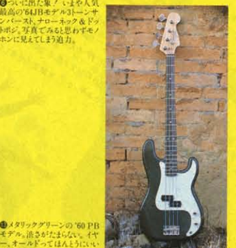
㊿ 1957 MODEL