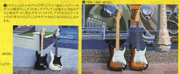
⑰ 1954/1960 MODEL

⑯ ジャズプレーヤーあふれるモアコースティックギターの代表的モデルがこれ。トワイ風プロジェクトチーム仕立てのジャズタイプピックアップをマウントした傑作モデル。