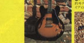
⑬ 1960 REFINE MODEL