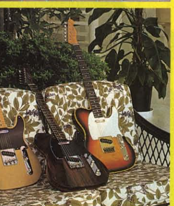
㊼ 1948/1969 TOKAI ORIGINAL MODEL