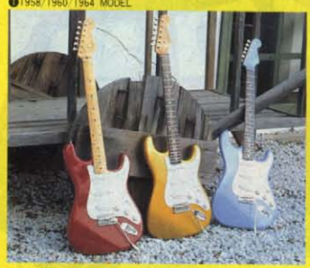
⑲ 60年代は実に色々なカラーが存在した年。トワイもスペシャルカラーシリーズで並べる。左から'58・CR・'60・GM・'64・SOの3モデル。スペシャルカラーシリーズについては別ページを参照。