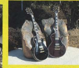
⑭ 1957 REFINE MODEL