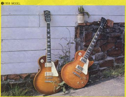
① 1959 MODEL ギヤオノ目にも鮮やかトラモクススタンダードモデル。'59年モデルをパーフェクトレプリカしたLS200V。左はご存知サンバーストスタンダードモデル。そして右がレンドロップしたヴィンテージフィニッシュスタンダード。経時変化でオールドはかのように退色していく。元の色がチェリーサンバーストだっ信じるのはい？こまごまコピーしているからトワイはすばらしい。とコメントしておこう。

よこそノ日本が世界に誇るオールドレプリカギターショーの始まりです。ごらんのおりヨダレものオールドギターが「ずらり」と思ったらこれははれさしたレプリカモデル。ブランドネームをかわらただけで間違って「One of a Kind」のオールドギターキケンたちだ。日本のギターフリークたちは幸せ者だね。こんなすばらしいセリカルモデルたちが時を超えてよみがえってくるのだから、OH/レプリカグラフィティ。このすばらしいオールドレプリカキケンたちに観戦。まずはとごらんあれ。