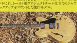
⑯ 1960 REFINE MODEL

⑫ これぞサンバーストスタンダードモデルの代表。目のさめるようなチェリーサンバースト'59モデル。トモクの出具合が心を傾らすニュー。