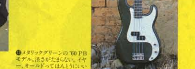
⑲ 1957 MODEL

㉗ メタリックレッドも鮮やかな'71 JBモデル。この人間工学を考えたスタリング。25年経たなくても充分新鮮なニュー。