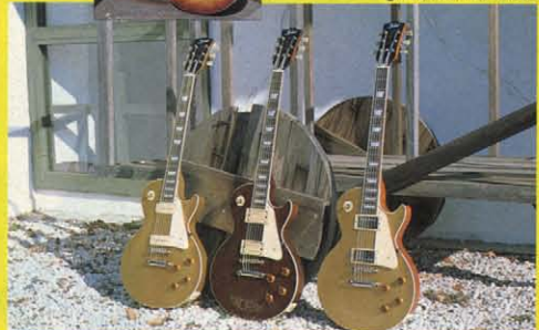
② 1956/1957/1957 MODEL