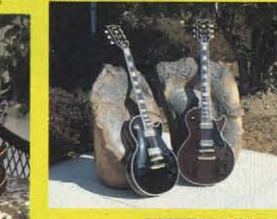
⑥ 1957 REFINE MODEL