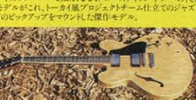
⑧ 1960 REFINE MODEL