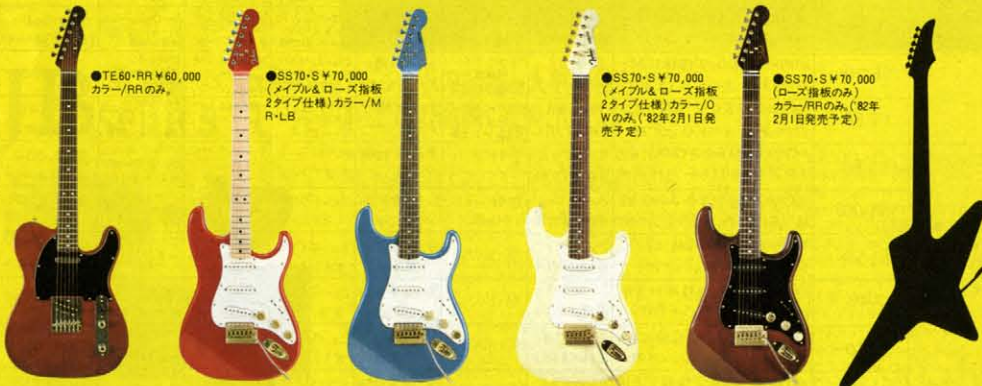
●TE60・RR ¥60,000 カラー/RRのみ