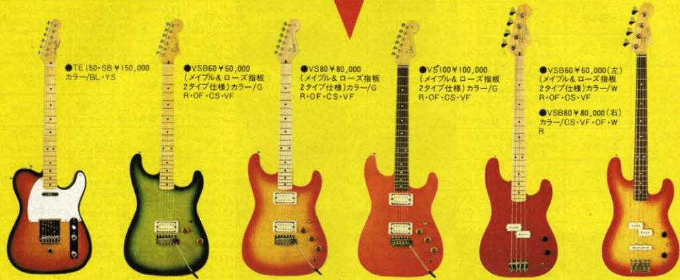
●TE150-SB ¥150,000 カラー/BL・YS

レギュラーモデルと並行して製作され続けるスーパーベックを満載したリミテッドエディション——限定生産モデル。トーカイエレクトリックギタープロジェクトチームにより定期的に製作される。これらのモデルは発表後即ソールドアウトとなりますが、その数量限定という特殊事情等により、購入希望者が絶えない場合、アンコールプロダクトとして再度製作することも可能となります。ただしこの場合、スペシャルサービス等、特典はつきませんのであらかじめご了承ください。受注後、納期1~3ヶ月で製作されます。過去、TE60・RR、VS60etcがアンコールプロダクトされています。今後もスーパーエディションともいふべき、時代に反映したスーパーギターをプロダクトし続けたいと思います。よろしくご声援ください。