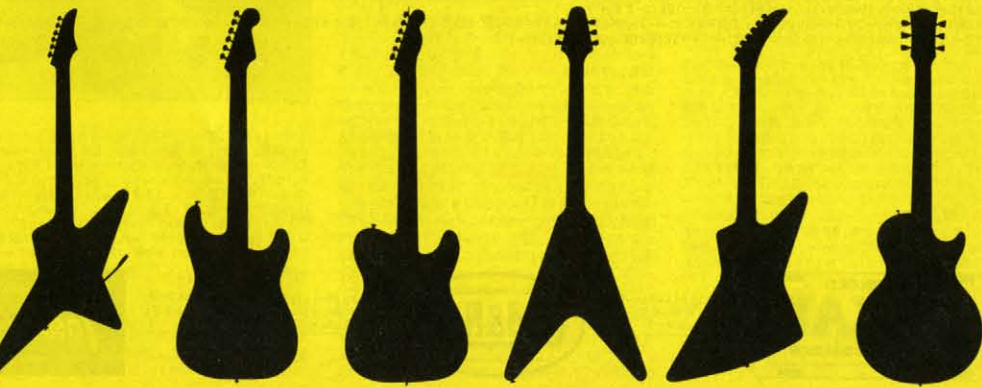
●SS70-S ¥70,000 (ローズ指板のみ) カラー/RRのみ、(82年 2月1日発売予定)