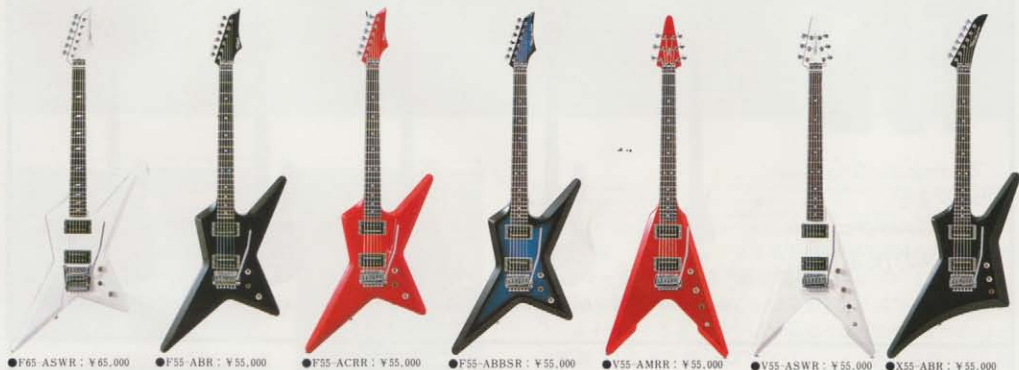
●F65 ASWR: ¥65,000 ●F55 ABR: ¥55,000 ●F55 ACRH: ¥55,000 ●F55 ABBSR: ¥55,000 ●V35 AMRR: ¥55,000 ●V35 ASWR: ¥55,000 ●X35 ABR: ¥55,000

●瞬時に0テンションポイントに達するスピーディーなアームダウン、リアクションもスピーディー。チューニングピッチの狂いも最少限。●オクターブ調整、弦高調整はチューニングした状態でも可能。弦はボールエンド切断不要、そのまま使用できる。●ブリッジロック方式によりブリッジ全体をロック。前後、横方向へのブレ、ガタツキ等は皆無。●ファインチューニングノブによってプレイ中の音程調整可能。適度なトルクによりプレイ中の接触による音程の狂いも完全防止。●スーパーナイフエッジスタッドボルト方式によりアーミングのリアクション精度を飛躍的に高めている。(アーミングがスムーズ) スタッドボルトでエアーズロッカーII全体の高さ調整可能。●簡単脱着、イージーマウント方式のアーム。アームトルク調整可能。ナイロンスペーサー入りだからアームをキズつけない。スムーズ回転。●驚異のメカニズム、意匠・実用新案出願中。