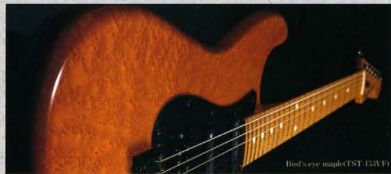
Bird's eye maple TST 153VF