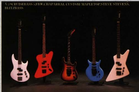
CRUISEBASS 5, FB, CHAPARRAL, CUSTOM, MAPLE TOP, STEVE STEVENS, BLITZBASS