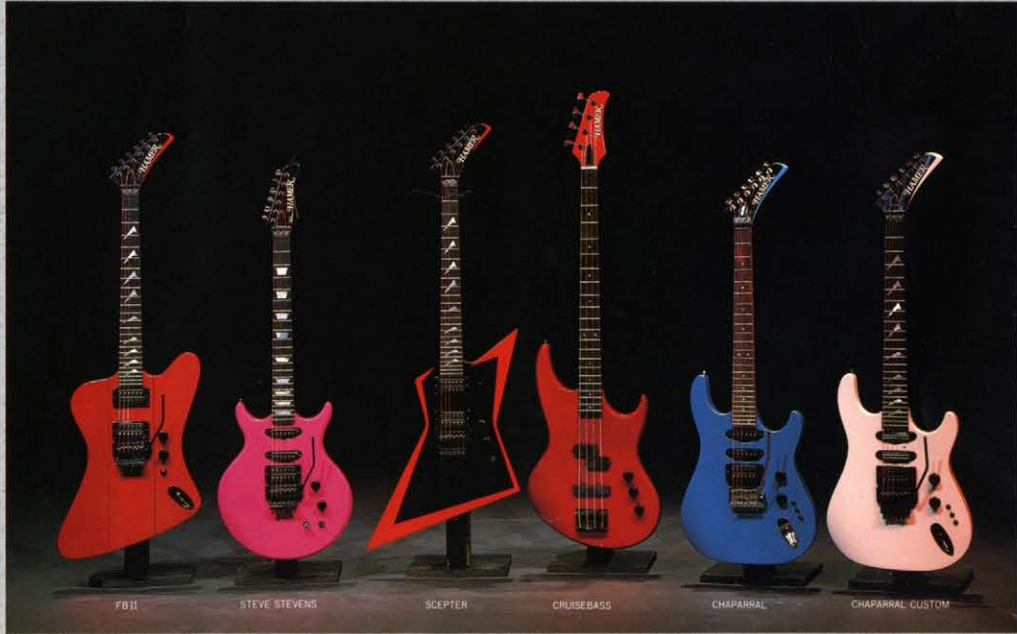
FB II STEVE STEVENS SCEPTER CRUISEBASS CHAPARRAL CHAPARRAL CUSTOM