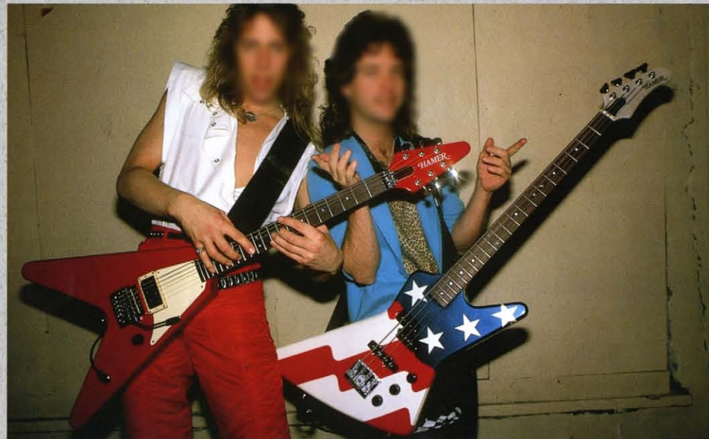
Jack Blades & Jeff Watson(Night Ranger)