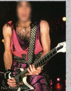
Paul Stanley (Kiss)