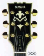
(RS) レッドセンターネック

このヤマハを手にする 世界を相手にする気分になるから不思議だ。 ザ・ソリッド・ハンバッカー「SG」