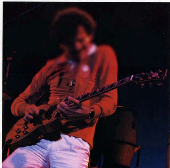
Carlos Santana SG CUSTOM : 1947年4月4日シカゴAurora生まれ。プロミュージシャンとしての父親の影響を受けて育つ。67年ロック ラテンを融合させたサウンドでレコードデビュー。官能的な味も「泣きギター」は従って、代表作「ロードスの伝説」。

ダイキャストブリッジ ボディに直接アセンブリされた 高い調性を誇るブリッジ。弦高調 整、オクターブ調整もひと回り大 きく正確なピッチを約束。SG-2000 にはサステインプレートも標準装 備。