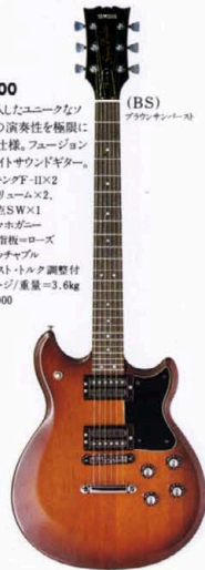
(BS) ブラックサンダー