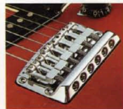
スチール切前ブリッジ

メイプルトップ・アルダー・バック ハンバッキング、シングルボビン双方のサウンドを活かせるユニークなラミネート削り出しボディ。フィット感がすばらしい。細心のボディカッティングが抜群の演奏性を約束。