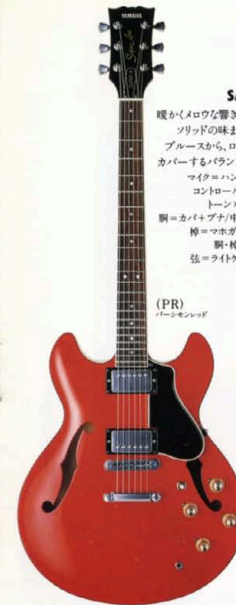
(PR) パールモンテッド

SA-1000 スコアの裏にひそむニュアンスと深みあててしる無類の一体感。絶妙のサウンドクオリティもトップアーティストの熱い支持がつけつづいたクオリティの本。 マイク=ハンパッキングA-II×2 コントロール=ボリゾム×2 トーン×2,3点SW×1 胴=カバ+ブリ/中芯=スプルース+メープル 橋=マホガニー/指板=エボニー 駒・棒=セツトネック 弦=ライトゲージ/重量=4.1kg ¥100,000