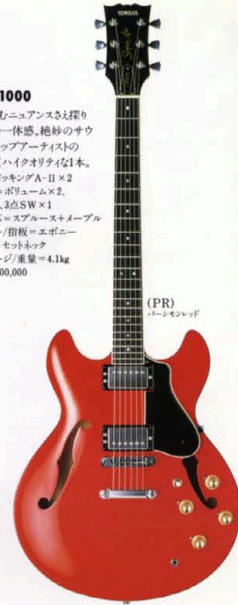
(PR) パールモンテッド

SA-1000 スコアの裏にひそむニュアンスと深みあててしる無類の一体感。絶妙のサウンドクオリティもトップアーティストの熱い支持がつけつづいたクオリティの本。 マイク=ハンパッキングA-II×2 コントロール=ボリゾム×2 トーン×2,3点SW×1 胴=カバ+ブリ/中芯=スプルース+メープル 橋=マホガニー/指板=エボニー 駒・棒=セツトネック 弦=ライトゲージ/重量=4.1kg ¥100,000