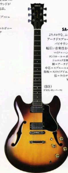
(BS) ブロンズパーペッツ

厳選された素材。細部まで一貫した入念な仕上げ。ハード面でも可能な限りの機能を搭載。その粒立ちのよいサウンドが弾き手の感性に応えるセミアコの逸品。 マイク=ハンパッキングA-I×2 コントロール=ボリゾム×2 トーン(ブリッシュロックSW付)×2,3点SW×1 胴=アーチドスプルース単板トップ 中芯=スプルース+メープル/橋=マホガニー 指板=エボニー/駒・棒=セツトネック 弦=ライトゲージ/重量=3.9kg ¥160,000