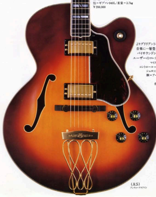
(AS) アンティークスチール

アーチドスプルース単板トップとカーブドスプルース削り出しトップ採用の機種は、表板割れを防ぐ入念なバックシール処理(注 2000S, 1200S)に加え、中芯ブロックをたないフルアコAEは、プロの船使にふさわしい弦の張力に耐えるネック構造を採用(注 1200S)。