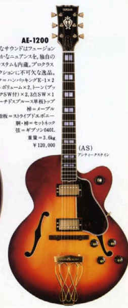
(AS) アンティークスチール

よりブリリアンなサウンドはフュージョン音楽に一層豊かなニュアンスを、独自のバイサウンドシステムも内蔵。プロクラスユーザーのコンディションに不可欠な逸品。 マイク=ハンパッキングE-1×2 コントロール=ボリゾム×2 トーン(ブリッシュロックSW付)×2,3点SW×1 胴=アーチドスプルース単板トップ 橋=メープル 指板=スチライグエボニー 駒・棒=セツトネック 弦=キープン040L 重量=3.6kg ¥120,000