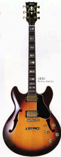
(AS) アンティークスチール