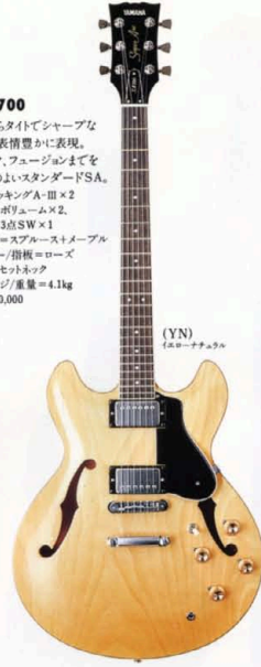
(YN) イエローナチュラル

SA-700 暖か(メロウ)な響きからタイトでシャープなソリッドの味まで表情豊かに表現。ブルース、ロック、フュージョンまでをカバーする9ポジションのハイスタンダードSA。 マイク=ハンパッキングA-III×2 コントロール=ボリゾム×2 トーン×2,3点SW×1 胴=カバ+ブリ/中芯=スプルース+メープル 橋=マホガニー/指板=ローズ 駒・棒=セツトネック 弦=ライトゲージ/重量=4.1kg ¥70,000