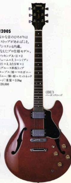
(BU) バーガンディレッド