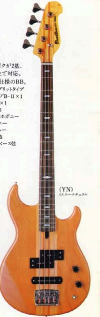
(YN) エボニー+ナチュラル

ワンプイス構造のボディにマイクが2基、ジャンルを越え幅広い音楽性で対応。卓越したライブ特性を誇るプロ仕様のBB。 マイク=(前)Wポールピース・スプリットタイプB-1×1(後)パーマグネットタイプB-II×1 コントロール=ボリューム×1 トーン×1、3点SW×1 調=アルダー+メープル+マホガニー 指板=ストライプエボニー 胴・枠=ワンプイス構造 弦=ロートサウンド/シングルベース弦 重量=4.5kg ¥150,000