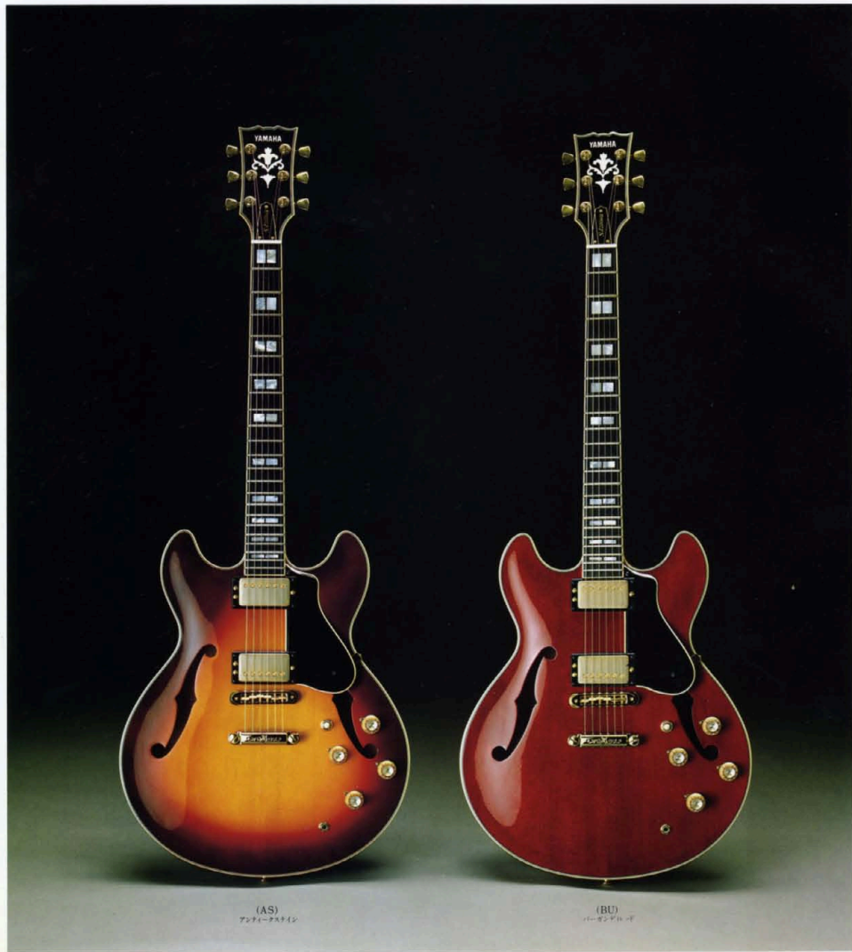
(AS) アンバー・スプラッシュ

胴材のちがいによる2系統のサウンド指向。 サウンドのバックボーンたる中芯ブロックは独自のアレンジによるもの。 ジャンルを超え、シーンの最深部で活躍するセミアコの逸品。