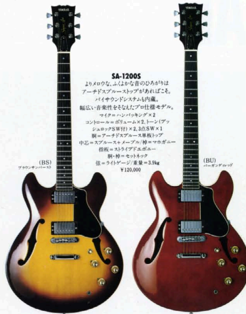
(BS) ブロンクォンバース