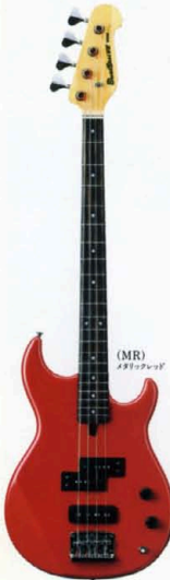
(MR) メタリックレッド

BB-2000の血統を 受け継ぎながらリヤマिता選定に あつたアプローチ。 カラー展開もぐっと意欲的な ステージパフォーマンスモデル。 マイク=(前)Wボールピース スプリットタイプ×1、 (後)Wボールピースタイプ×1 コントロール=ボリューム×1、 トーン×1、3点SW×1 駒=アルダー/枠=メープル 指板=ローズ 駒+枠=デタッチャブル 弦=ラウンドワウンド 重量=4.3kg ¥80,000