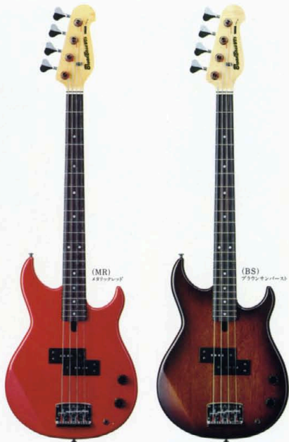
(MR) メタリックレッド

ディテールを含め、基本はショートスケールモデルとし て開発。ギターのように弾きまじる無限のテクニクをな えたプロベージスに、2バンドEQ内蔵。マイク=Wボ ールピーススプリットタイプ×1/コントロール=ボリューム×1、2 バンドEQ/駒=アルダー+メープル+マホガニー/枠=メ ープル+マホガニー/指板=スライヴドエボニー/駒+枠=ワ ンピース構造/弦=ショートスケール用ラウンドワウンド 重量=4.1kg/¥150,000