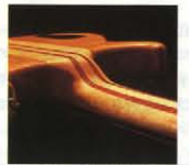
●深いサスティンのワンピース