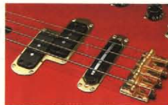
●フラッグシップBB-3000の2PU構成

プリアンプ専用PUです。BB-3000、2000、Xに採用。 ●8ポールピースタイプ：弦1本に2個ずつのマグネット、弦振動エネルギーをロスなくキャッチして、ストレートでタイトな音量レスポンスをつくり出します。(BB-3000、BB-V) ワンピース構造/デタッチャブルネック 弦振動が切れめなく全身につたわるワンピース構造はボディ材の鳴りがフルに生きた伸びのよいサスティンが特徴。一方、オーソドックスなボルト固定のデタッチャブルネックは、タイトでシャープなレスポンスが得られます。ロング、ショートとも21フレット BBはスタンダードなロングスケールだけでなくショートスケールBBも含めすべて21フレット。1弦で最高Eまでをカバーするワイドなサウンドレンジを誇ります。そしてショートスケールは全長で73mm、スケールで60mmマイナス。抜群の演奏性で奏者をバックアップします。