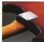
●アタッキーなデタッチャブル