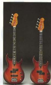
●身長は選べてもBBはBB