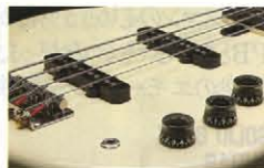
●8ポールピースPU&2V・1TはBB-V10