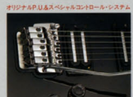
オリジナルボディ&スペックのフロントローディングシステム HR-III

ボディ:バスクワッド ネック:メイプル+マホガニー(スルーネック) フィンガーボード:エボニー+2F(35BR) ナット:エボニー ブリッジ:ロッキングマシンジックII ピックアップ:ハワード・パウル・ニューヨークタイプ オーブ・ハム・バックアップ(LED) コントロール:マスターボリューム、マスタートーン フロロイド・リグ・ボリューム スケール:628mm ハードウェア:ゴールド フィニッシュ:クリアラッカー(CHL) ウェイト:3.5kg