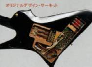
オリジナルデザイン・サーキット HR-III ¥60,000

ボディ:バスクワッド ネック:メイプル+マホガニー(スルーネック) フィンガーボード:エボニー+2F(35BR) ナット:エボニー ブリッジ:ロッキングマシンジックII ピックアップ:ハワード・パウル・ニューヨークタイプ オーブ・ハム・バックアップ(LED) コントロール:マスターボリューム、マスタートーン フロロイド・リグ・ボリューム スケール:628mm ハードウェア:ゴールド フィニッシュ:クリアラッカー(CHL) ウェイト:3.5kg