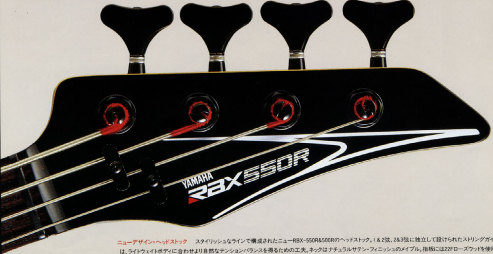
ニューデザインヘッドストック スタイルリッシュなラインで構成されたニューRBX-550R&500Rのヘッドストック。1 & 2弦、2 & 3弦に独立して設けられたストリングガイドは、ライトウエイトボディに合わせより自然なテンションバランスを得るための工夫。ネックはナチュラルサテンフィニッシュのメイプル。指板には22Fローズウッドを使用。

フロントP.U.とリアP.U.のバランスをセンターにし、得られたバランス・サウンドのコンピュータ解析グラフ。音質特性の点においては、リアタイプUのコントロールの特性が現れています。また、中域から高域にかけての音響構成、アタック時の瞬時の応答も優れており、リアタイプUの特性である"ライブ"なサウンドを、さらに力強く表現力豊かに引き出します。コントロールは、マスター・ボリューム、バスターン・マスターのコントロールも引き出します。