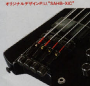
ヘッドレスネック「3D Dimension」ボディ、テールユニオンなど、多層「新世代」アイデアが詰め込まれた。P.U.には新開発マウント、アナログコンタクト距離の調整可能ハムバッカー「SAHB-XIC」は、ストレーンローラーが歪みを低減し、ボディフレックスを抑制する。また、このヘッドレス構造により、ドロップインの効果を弱め、ライブでの真の音質を発揮します。