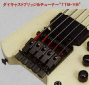
BXシリーズのチューナーは、ボディ裏面にブリッジと一体化してフロント。この大幅な変更により、ボディのフレックスを一律に排除。身体に近い位置での検知と、正確なピッチ検出を実現。ダイキックの振動がボディ共振によるドロップインの効果を弱め、ライブでの真の音質を発揮します。

ヘッドレスヘッドベース 独特のヘッドレス構造が、ライトウェイトコンパウンドボディと重ね合わせ、フェルバランスの弾性をもたらし、ネックの歪みをなくす構造により、ローポジションプレイも容易、ヘッド裏面の新しいピックアップは、各種エレキギターの中でも、最もクリアで伸びやかなサウンドを実現している。新しい機能性を発見しよう。