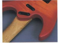
Super Play Ability Joint System

トラステム、かつてない軽快なハイフレット プレイを可能にしています。さらに、ダブ ルカットウェイのボディトップを大胆に カットしたデザインがハイポジションでの 無難なプレイアビリティを獲得。さらに、 ヤマハならではのオリジナルシェイプです (RGX-1200, 800, 600 の全モデルに採 用)。