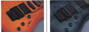
RGX-612J P.U. & Control System

CONTROL (RGX-612J) マスターヴォリューム、フロント+センター ーン、リアトーン、5ポジションP.U.セレクタ ーSWに加え、リアトーン・ノブにはバイサ タルSWを内蔵したシステムが、ワ ン・ノブでのサウンドクリエイティブな サウンドを可能にします。