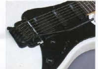
RGX-512J P.U. & Control System

(500 Series) マスターヴォリューム、マスタートーン、5ポ ジションP.U.セレクターSW(SG2Jのみ3ポ ジション)、シンプルな構成は、ライブに その威力を発揮します。また、512J, 520Jに はマスタートーン・ノブにバイサウンドWも 内蔵の新開発P.U. "YAMAHA SELECT by EMG" の個性を最大限に生かすコント ールシステムです。