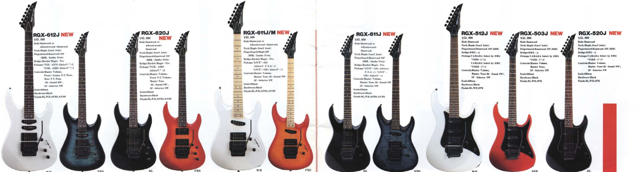
●RGX 600&500 SERIES COLOR: BL(ブラック), WH(ホワイト), PRS(パーレーツキャンパーズ), NBS(ネバーブルーキャンパーズ), SPR(スプライト) ●RGX 600&500 SERIES COLOR: BL(ブラック), WH(ホワイト), PRS(パーレーツキャンパーズ), NBS(ネバーブルーキャンパーズ), SPR(スプライト) ●RGX 600&500 SERIES COLOR: BL(ブラック), WH(ホワイト), PRS(パーレーツキャンパーズ), NBS(ネバーブルーキャンパーズ), SPR(スプライト)