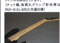
Maple Fingerboard & Oil Finish Neck

NECK ネックのフィニッシュ は、マニアクラスなナチュラル オイルフィニッシュを採用。弾き こむほどにプレイヤーのテストに 変化していく独特のベアウッド フィニッシュが、ハイ スピードピッキングにベスト フィット。RGX スペシャルモデルならではの、 極上のグリップ感を提供して います。フィンガーボード、 611Jにはローズウッド、611J(M) にはメイプルを採用しています。 (ナット、指板、R、グリッ プ形状等はRGX-612J, 620J 共通仕様)