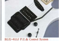
RGX-611J P.U. & Control System

P.U.はRGX-1200シリーズと 同仕様の "LIVE" ーGH(ハム バック) & "LIVE" ー GS(シングルコイル) を搭載。 マニアクラスのハイブリッド ピリアイジョイント・プロ フェッショナルサウンド システムをマウント。マ ウント方法も、シ ングルコイルのコン テンラー・ナルックスを 採用しています。