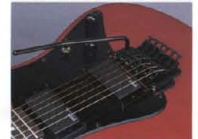
New Design Tremoro System "RMX-II"

■Rockin' Magic-Proの詳細はP.28-29の コラムで。 (500 Series) シンプルながら基本を押えた新開発 トレモロシステム "RMX-II" をマウント。精 確なブラックフェイス、2点ナイフエッジ方式