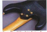
Super Play Ability Joint System & Exoticwood & Alder Body

Jim Dunlop #6100 Fret (Made in U.S.A.) ネックとボディの接合は、ヤマハが生んだ新たなトレンド、独自のスーパープレイアビリティ・ジョイントシステム方式でビルドアップ。驚くほどのロジスティックを実現。併せて、ハイフレットのフィンガーボードもスムーズそのものです。