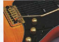
Low Impedance P.U. & Active Control System

とくにミッドブーストは、極めて効果的なインクが得られる周波数帯に独自のカット(S00Hz~1KHzを最大値)10dBブーストを設定する事により、中・高域のデリケートなサウンドメイキングに威力を発揮します。さらに、912Jにはこのクラスで初めてローインピーダンスP.U.ながら、エレトロニック・コイルスプリットシステムを搭載。従来のシングルコイルサウンドとは一線を画した、シャープ&プリアットなローノイズサウンドを演出します。