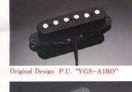
Original Design P.U. "YGS-A180"