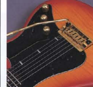
New Design Tremolo "Vintage-Pro"

(700 Series) ノンロック・トレモロシステム"Vintage-DX"をマウント。最もディジナルで、ポジチャーな点支持方式のユニットながら、独自の"ローラーナット"との組み合わせにより、かつてないスムーズなアミングを約束します。