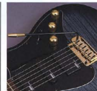
"Vintage-DX" Tremolo Unit

(700 Series) ノンロック・トレモロシステム"Vintage-DX"をマウント。最もディジナルで、ポジチャーな点支持方式のユニットながら、独自の"ローラーナット"との組み合わせにより、かつてないスムーズなアミングを約束します。