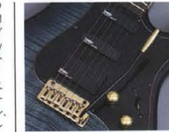
YAMAHA SELECT by EMG "YSES-1" & "YSEH-1" されたフュージョン・スピードかつ確実な操作性で、ライブにより一層の威力を発揮します。

712Jには、ハムバッキングP.U.の片方のコイルをバイパスして、シングルコイルサウンドを出力する"バイパスサウンドシステム"も装備。スイッチはリア・トーンノブに内蔵