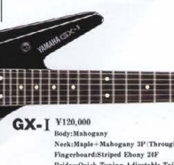
●GX-I SERIES COLOR:BL(ブラック)