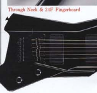
●GX-I SERIES COLOR:BL(ブラック)