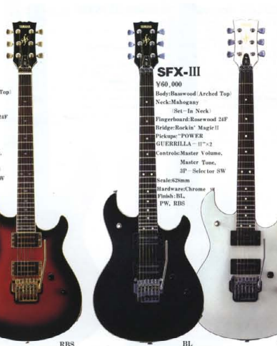
●SFX SERIES COLOR:BP(ブラックパール),WR(ワイルド),PW(パールホワイト),RBS(レッドブロッサムパール),BL(ブラック)

BODY HR-Iのボディ構成は、メイプル・トップ+マホガニー・バックのサイドウイングをスルーネックにサンドイッチ。コンチネンタルなスルーネックのシャープサウンドと、トラッドなメイプル+マホガニー・ボディのウォームボディデザインは、クラシカルなカープをもつエキゾチックシェイプ。最終フレットまで無理のないフィンガープレイを約束するディープ・カットウェイ。楽器全体のウェル