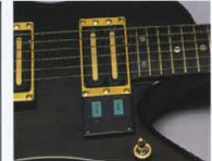
Touch Switch System

ター-SWというユニークな構成です。特にHR-Iでは、マスタートーンに内蔵されたバイバイワンドシステム、Mag/PiezoP.U.バリエーション、コンプレッサー・タッチシステム、PiezoPickup・タッチシステムなど、スペシャルファンクションを装備。ボディサイドにはキャリブレーション機能。内蔵の本格派クロマチックチューナーもマウント。いつでも、LED表示で正確なチューニングが可能です。