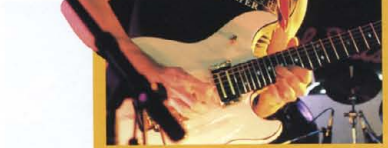
RIK EMMETT FRIENDS TREMOLO UNIT

瞬間にシングルコイルP.U.に切り換えD.K.スイッチは、ミニ・トルク-SW(SFX-I)、あるいはトーンコントロール・ノブのプッシュ(SFX-II)で、ワンタッチ、ワイルドなグランドプレイから、一変、クリアなバッキングへ。こなす早さも難無くこなします(SFX-I & II)。