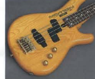
Ash Body & Gold Hardware

BODY 音抜けがよく、ねばりのある中低域が特徴の高級素材、アッシュ材をセンター2プライ構成でビルドアップ。美しい木目を生かしたデザインとゴールドハードウェアとのマッチングにより、上品機種に迫るハイグレードなルックスも実現しています。