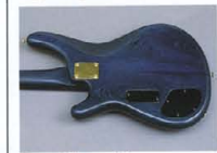
Contoured Cutaway Body

PICK UP MB-I C, MB-I PJCS マスターヴォリューム・パラシター・トランプ、ペーシ、ALP構成のコントロール・システムには、新設計のアクティブサーキットを内蔵。同P.U.のミキシング、高音域、低音域それぞれのコントロールにより、ローインピーダンスP.U.の魅力を100%活かし、幅広いトーン・ワリエーションをクリエイトします。