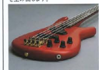
Original Design Round Top Body

に施されたコンタードカットウェイにより、体との密着性が大幅にアップ。計算し尽された質量バランスとの相乗効果で、優れたプレイアビリティを表現しています。全モデル、アウトレットシールドはボディサイドにレイアウト。MB-IIIには、ボディ材にバスマッドを採用、P.U.とのコンビネーションにより、ロングスケールベースにも匹敵するパワフルなサウンドを生み出します。