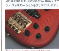
New Design Active Control System

MB-III S 切れのいいサウンドとダイレクたレスポンスが持ち味のセラミックマグネットを採用した"B HEART III"を搭載。ミドルクラスタイプにも匹敵する、パワフルな重低音とシャープな中高音を両立させました。