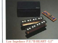
Low Impedance P.U. "B HEART LI"

PICK UP MB-I C, MB-I PJCS マスターヴォリューム・パラシター・トランプ、ペーシ、ALP構成のコントロール・システムには、新設計のアクティブサーキットを内蔵。同P.U.のミキシング、高音域、低音域それぞれのコントロールにより、ローインピーダンスP.U.の魅力を100%活かし、幅広いトーン・ワリエーションをクリエイトします。