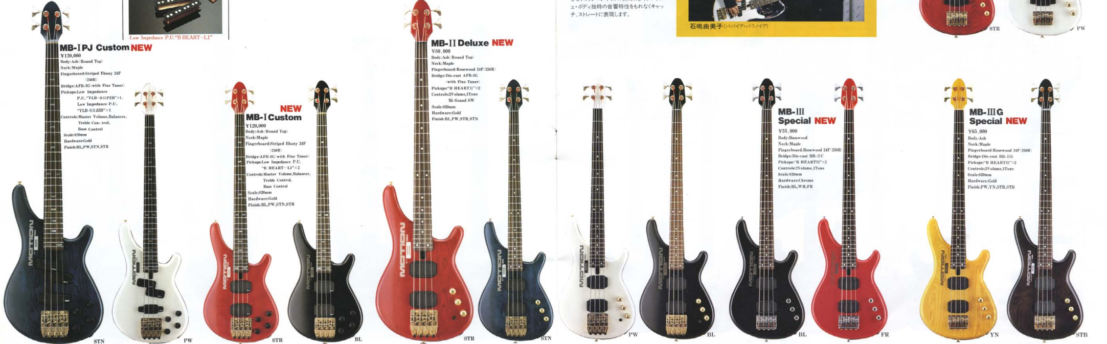
●MB SERIES COLOR: BL(ブラック), PW(パールホワイト), STN(シースーパールベージュ), STR(シースーカラーレッド), WH(ホワイト), ER(フィンランド)